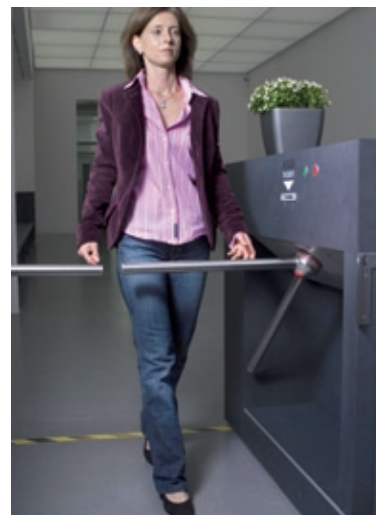
Holm-Position beim Versuch, unberechtigt einzutreten