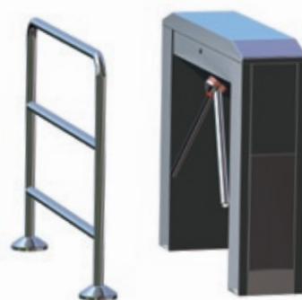
Drehstern-Position bei Evakuierung oder barrierefreiem Eintritt