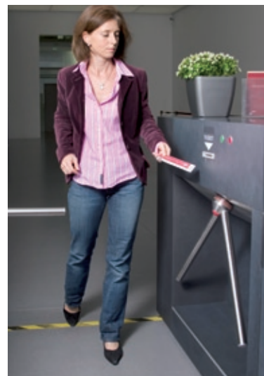
Holm in OPEN GATE - Position bei normaler Zutrittskontrolle

GOTSCHLICH 2-Arm-Dreh Sperren können jederzeit ohne technischen Aufwand zwischen den Betriebsarten „2-Arm-Dreh Sperre“ und „OPEN GATE“ umgestellt werden. So ist auch ein Wechselbetrieb im Tagesablauf möglich.